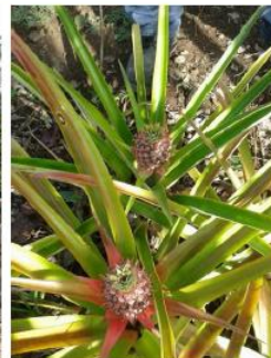
Predio San Pedro Abad